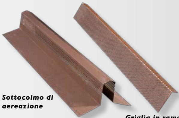
Sottocolmo di aereazione