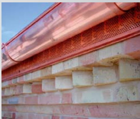
Griglia in rame